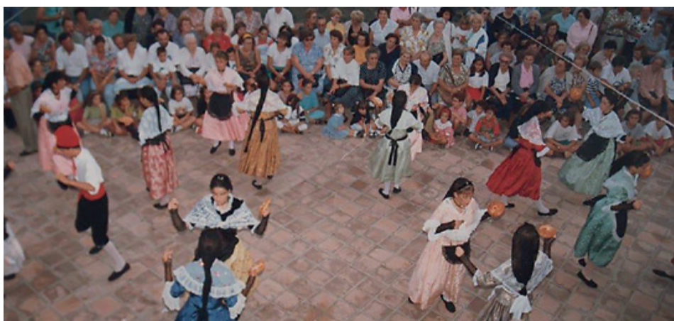
Fotografía del año 1992 en que se recuperó el Ball de Coques.

El Ball de Coques de Mont-roig ha sido declarado Bien Cultural de Interés Local. El Pleno del Ayuntamiento de Mont-roig del Camp de 14 de junio, recogiendo la propuesta de l'Associació de Veïns Muntanya Roja, le otorgó esta distinción. Se trata de un elemento festivo patrimonial de nuestro pueblo, documentado hace más de 200