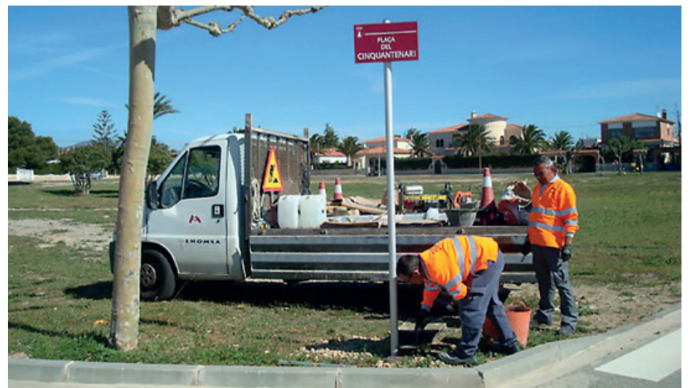
SEÑALIZACIÓN DE PLAZAS DE MIAMI PLATJA

La playa del Estany Gelat dispone de unas nuevas escaleras de acceso. Los trabajos han consistido en la demolición de los antiguos escalones, desgastados y con fuerte desnivel para construir una nueva infraestructura que destaca por tener el doble de escalones de hormigón estampado y que, además, incorpora una barandilla.