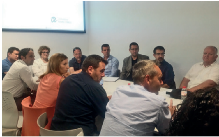
Imagen de la primera reunión de la Mesa Estratégica de Turismo.

La Mesa de Turismo servirá como plataforma de interlocución para la orientación, planificación, seguimiento y supervisión del Plan Estratégico de Turismo, que ya se ha puesto en marcha. Este, se está desarrollando a través de un convenio con la Universidad Rovira y Virgili, encargada de elaborar un diagnóstico riguroso so-