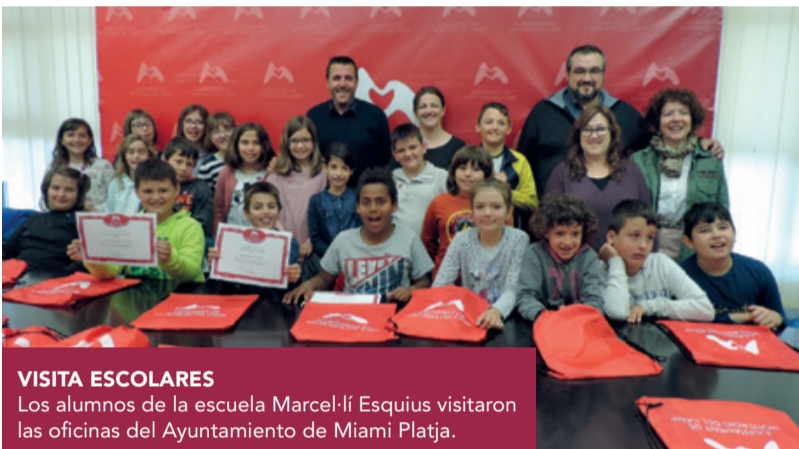
VISITA ESCOLARES Los alumnos de la escuela Marcel·lí Esquíus visitaron las oficinas del Ayuntamiento de Miami Platja.