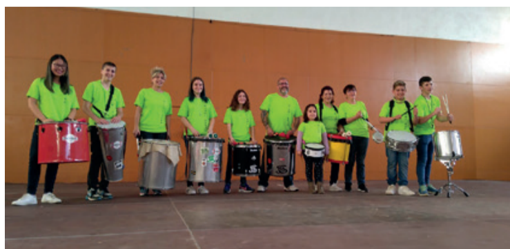
Imagen de la formación en un día de ensayo.

Con tres años de historia, el grupo de batucada Miami Sona ya ha conseguido hacerse un nombre. Están presentes en la mayoría de actos festivos que se celebran en Miami Platja y sus actuaciones son éxito asegurado.