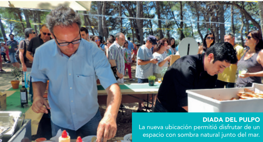
DIADA DEL PULPO La nueva ubicación permitió disfrutar de un espacio con sombra natural junto del mar.