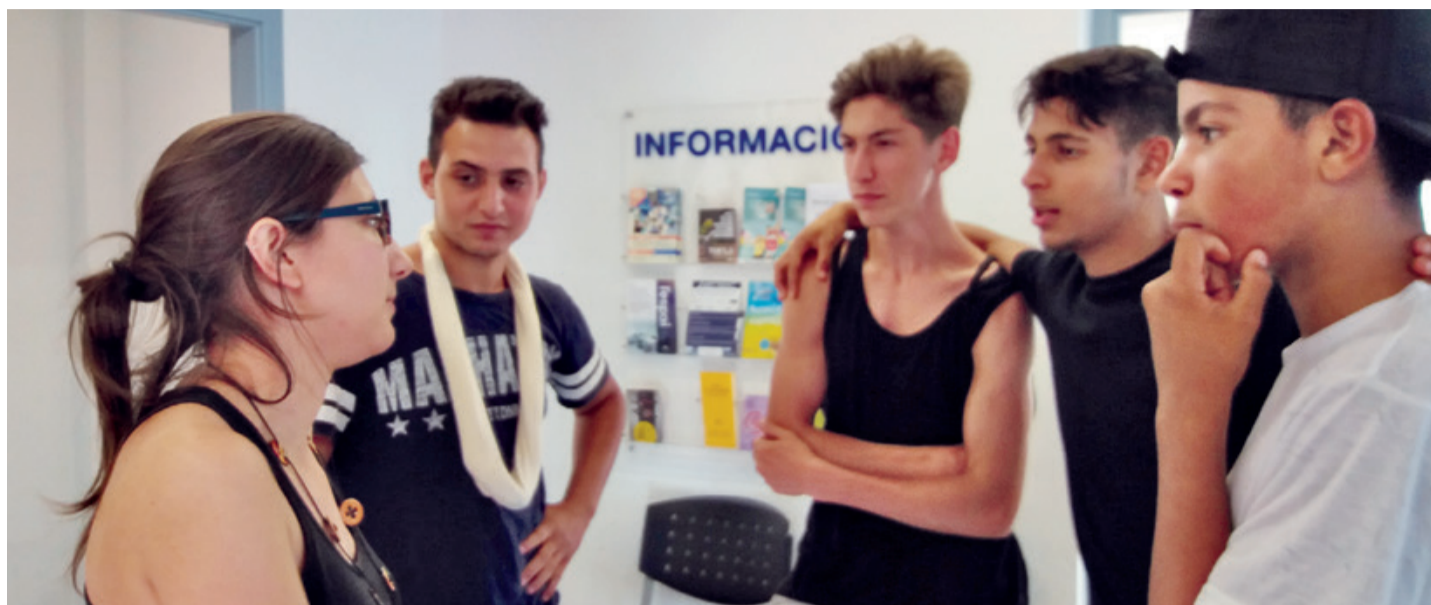
Una técnica se reúne con los jóvenes para conocer sus necesidades.

El objetivo del Pla de Barris es dar una respuesta socio-educativa a los jóvenes y fomentar el empleo de las mujeres