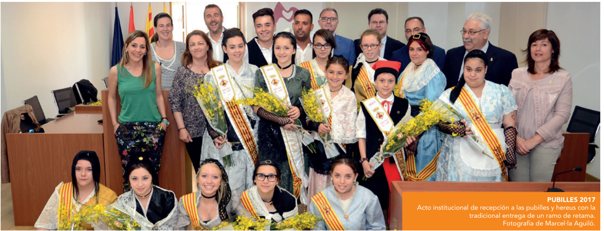
PUBILLES 2017 Acto institucional de recepción a las pubilles y hereus con la tradicional entrega de un ramo de retama.