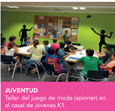
JUVENTUD Taller del juego de moda (spinner) en el casal de jóvenes K1.