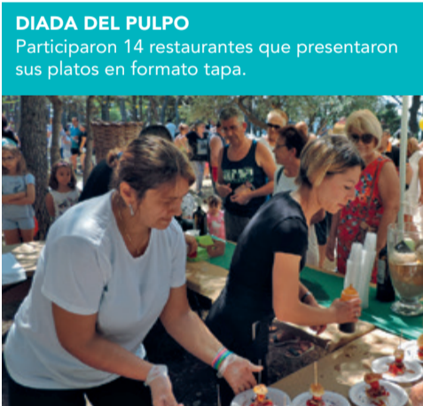
DIADA DEL PULPO Participaron 14 restaurantes que presentaron sus platos en formato tapa.

¡Los meses de primavera son una buena oportunidad para disfrutar del buen tiempo! Si eres de los que ha participado en las actividades que se han programado en el municipio... Búscate