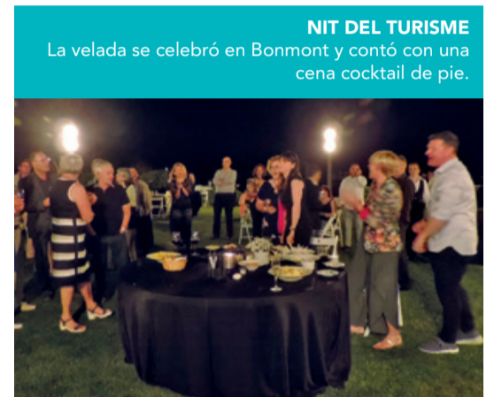
NIT DEL TURISME La velada se celebró en Bonmont y contó con una cena cocktail de pie.