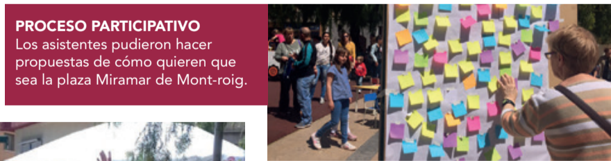
PROCESO PARTICIPATIVO Los asistentes pudieron hacer propuestas de cómo quieren que sea la plaza Miramar de Mont-roig.