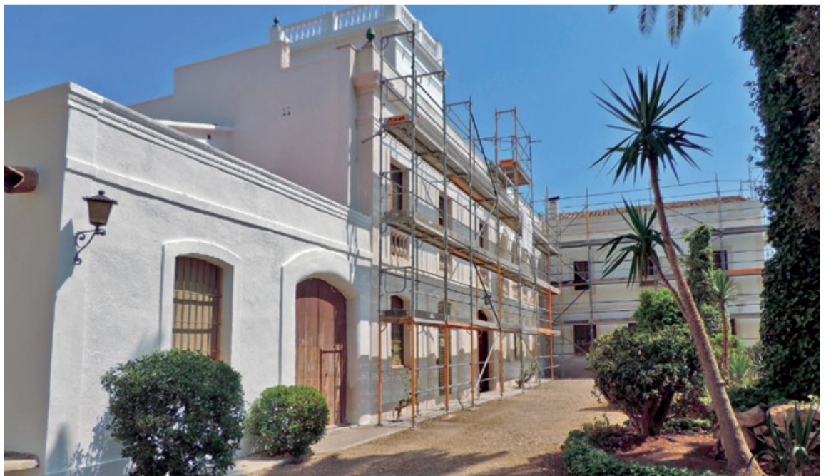
En esta imagen se pueden ver los trabajos de conservación del edificio principal de Mas Miró.

Proyecto de rehabilitación a cargo del estudio RCR de Olot, ganador de la última edición del Pritzker de arquitectura.