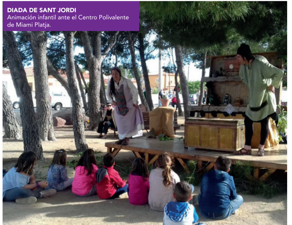
DIADA DE SANT JORDI Animación infantil ante el Centro Polivalente de Miami Platja.