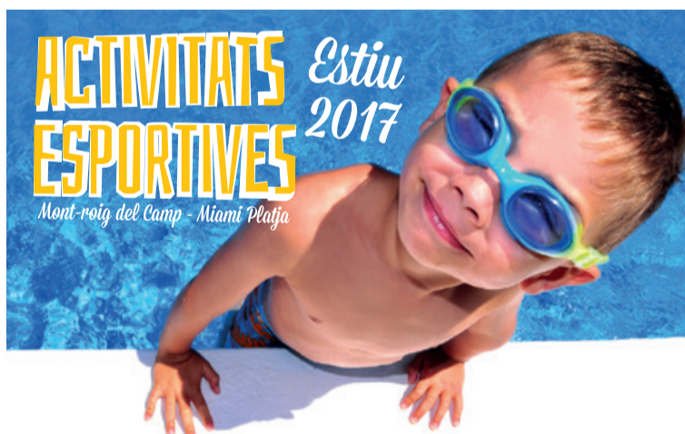
Imagen promocional de las actividades deportivas de verano.

Las actividades se realizarán de lunes a viernes, de 9 a 14 h, en la base náutica de la playa Cris-tall, en la piscina municipal, en los polideportivos o en el Club de Golf Bonmont. Este año, como novedad, se ofrecerá un servicio de acogida por 1 € al día. Así, las familias que lo necesiten podrán llevar a sus hijos a las 8 de la mañana. El horario también se amplía con el servicio de comedor. Además, todos los niños y niñas con beca