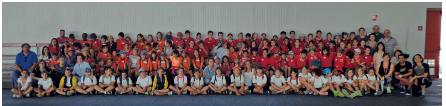
JORNADA ESCOLAR Fotografía divertida de los alumnos participantes en la primera jornada lúdico-deportiva de las 3 escuelas.