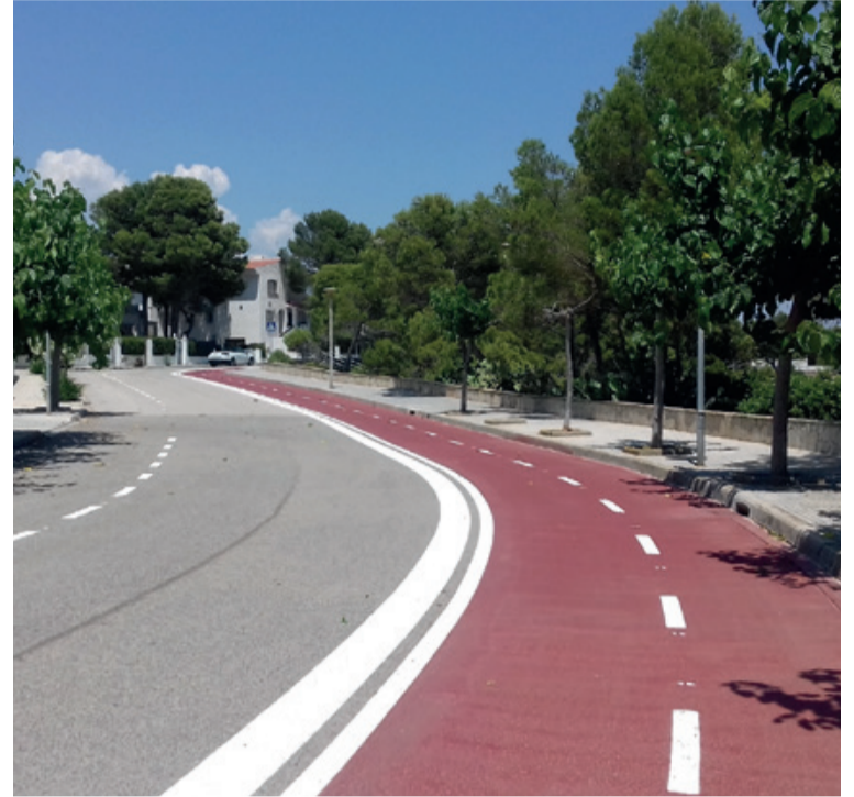
Se espera que el carril bici una el Estany Gelat con el río Llastres.