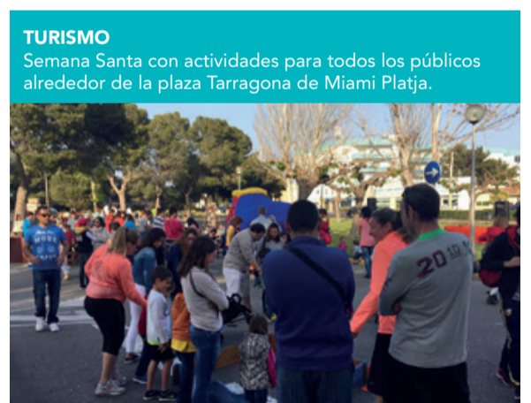
TURISMO Semana Santa con actividades para todos los públicos alrededor de la plaza Tarragona de Miami Platja.