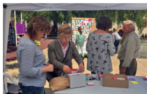
PROCESO PARTICIPATIVO PLAZA MIRAMAR La fiesta participativa sirvió para escuchar las necesidades del vecindario.