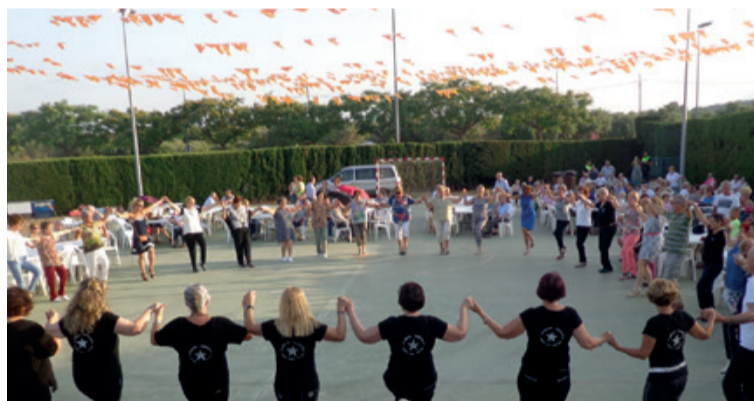
Celebración de los 30 años de la inauguración del casal.

El lunes; servicio de podología y encaje de bolillos, el martes; talleres de memoria, el miércoles; pintura, el jueves; sardanas y country, el viernes; taichí y toda la semana servicio de peluquería, aula de informática y bar. El Casal d'Avis de Mont-roig está abierto cada día de la semana para que sus 350 socios puedan disfrutar de un espacio donde encontrarse y realizar actividades. Ya hace 30 años que se inauguró y