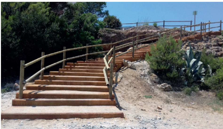
NUEVAS ESCALERAS DE ACCESO A LA PLAYA DEL ESTANY GELAT

El Ayuntamiento ha iniciado los trabajos para hacer una zona peatonal que unirá la avenida Oleastrum con la avenida Barcelona por debajo del actual puente de la vía del tren. Esta zona dispondrá de alumbrado público, hasta ahora inexistente y estará delimitada con pilonas de goma. Los dos carriles de circulación se han desplazado para poder ganar más anchura y espacio para los peatones que se ubicarán al lado este del tramo de calle. El objetivo es dotar de más seguridad una zona de tráfico que no disponía de espacio para pasar caminando.