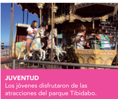
JUVENTUD Los jóvenes disfrutaron de las atracciones del parque Tibidabo.