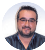
PSC Enrique López Tercer teniente de alcalde ACCIÓN SOCIAL, MAYORES, VIVIENDA SOCIAL, SOLIDARIDAD, COOPERACIÓN, EDUCACIÓN, FORMACIÓN Y GUARDERÍAS, INFANCIA Y FAMILIA.