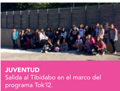
JUVENTUD Salida al Tibidabo en el marco del programa Tok'12.