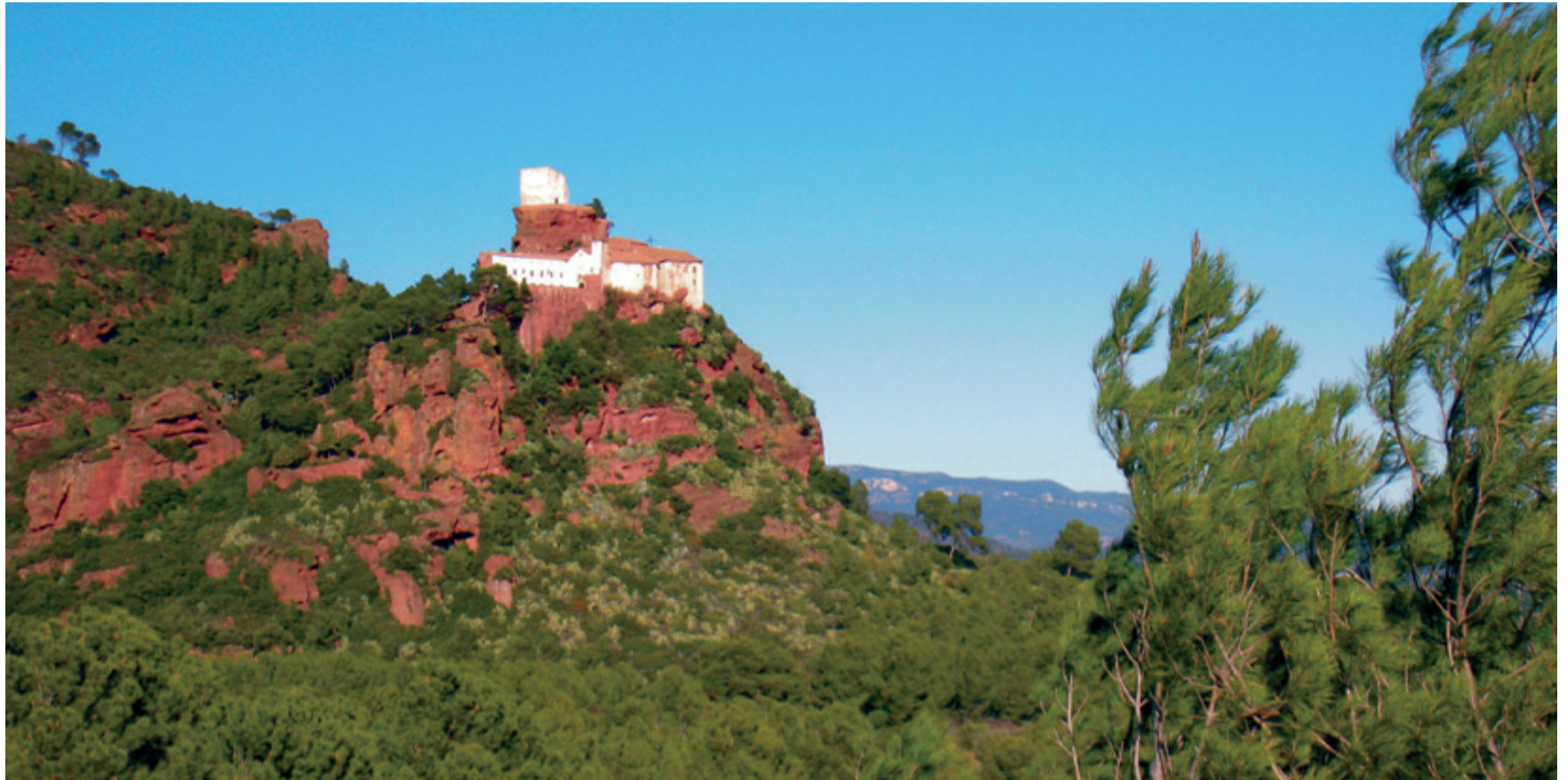
La montaña que alberga la Ermita está formada por bloques de piedra.

Una de las primeras acciones que se ha llevado a cabo ha sido un estudio sobre la estabilidad de la ladera sureste del PEIN Mare de Déu de la Roca. El objetivo era determinar el estado en que se encuentran los bloques que conforman la montaña y anticiparse a posibles desprendimientos. El estudio ha definido 10 zonas donde se espe-