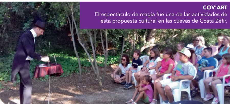
COV'ART El espectáculo de magia fue una de las actividades de esta propuesta cultural en las cuevas de Costa Zèfir.