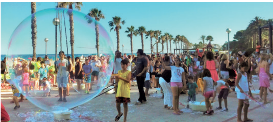
Los talleres y la animación infantil son algunas de las propuestas de la programación.

Aprovechando la campaña de vacaciones y los meses de julio y agosto, son varias las actividades programadas para complementar la oferta tradicional de sol y playa.