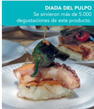
DIADA DEL PULPO Se sirvieron más de 5.000 degustaciones de este producto.