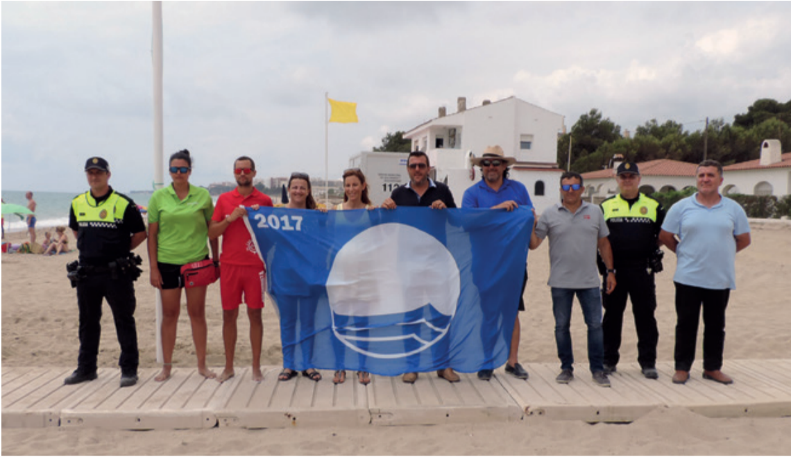
Se ha obtenido una Bandera Azul en la playa de la Casa dels Lladres.

La temporada turística se inicia con la recuperación de la tercera Bandera Azul, y la obtención, por primera vez, de una bandera Eco-playas y de un Sello de Cicloturismo.