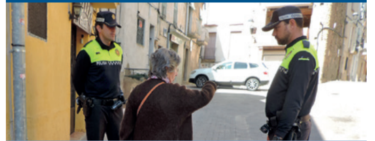
Una imagen del nuevo servicio de proximidad en Mont-roig.

El Ayuntamiento ha puesto en marcha un nuevo servicio de atención policial en el núcleo de Mont-roig. Este servicio, que entró en funcionamiento el mes de mayo, se ofrece de lunes a domingo, de las ocho de la mañana a las dos de la tarde, y sirve para reforzar el servicio policial en el pueblo.