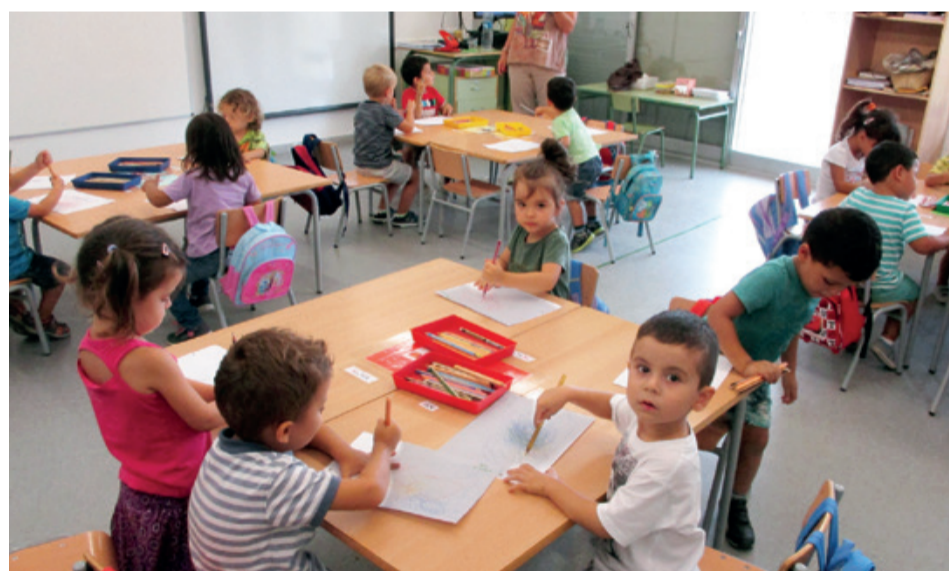
Este curso la escuela Joan Miró ha tenido una sola línea de P3.

Platja, en que prácticamente el 100% de los alumnos de las dos escuelas de este núcleo se quedarán a estudiar allí. Otra de las novedades es el nuevo ciclo formativo de Sistemas microinformáticos y redes con 19 preinscritos. Por otra parte durante el verano se realizará una reforma del comedor de la escuela Mare de Déu de la Roca. Próximamente está previsto rehabilitar también la cocina de este centro. Por estas dos obras el Ayuntamiento aportará 150.000 € y la Generalitat 87.000 €.