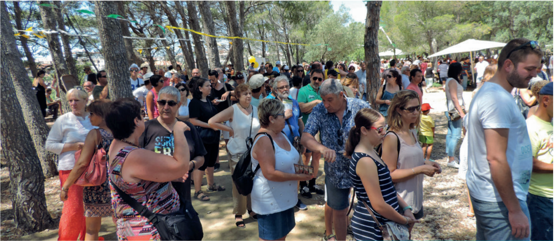
DIADA DEL PULPO El Bosquet del Llastres acogió uno de los actos gastronómicos más multitudinarios que se celebran en el municipio.