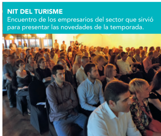
NIT DEL TURISME Encuentro de los empresarios del sector que sirvió para presentar las novedades de la temporada.