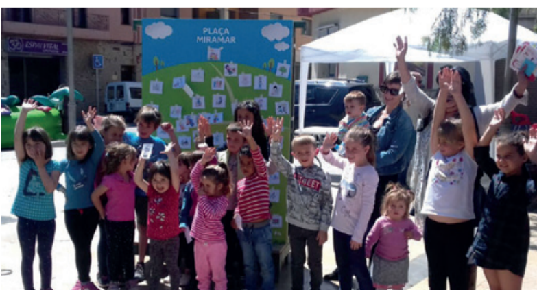
PROCESO PARTICIPATIVO PLAZA MIRAMAR Los niños también pudieron pintar y participar en esta jornada festiva.