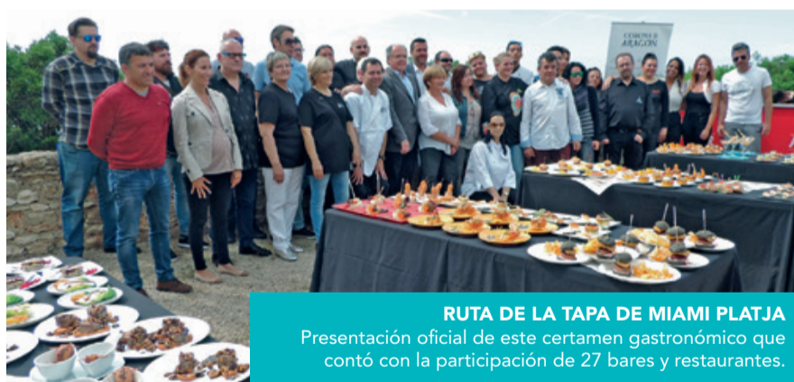
RUTA DE LA TAPA DE MIAMI PLATJA Presentación oficial de este certamen gastronómico que contó con la participación de 27 bares y restaurantes.