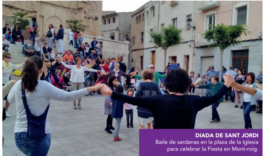
DIADA DE SANT JORDI Baile de sardanas en la plaza de la Iglesia para celebrar la Fiesta en Mont-roig.