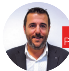
PSC Fran Morancho Alcaldía