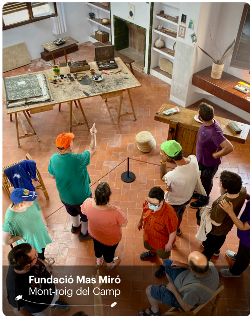
Fundació Mas Miró Mont-roig del Camp