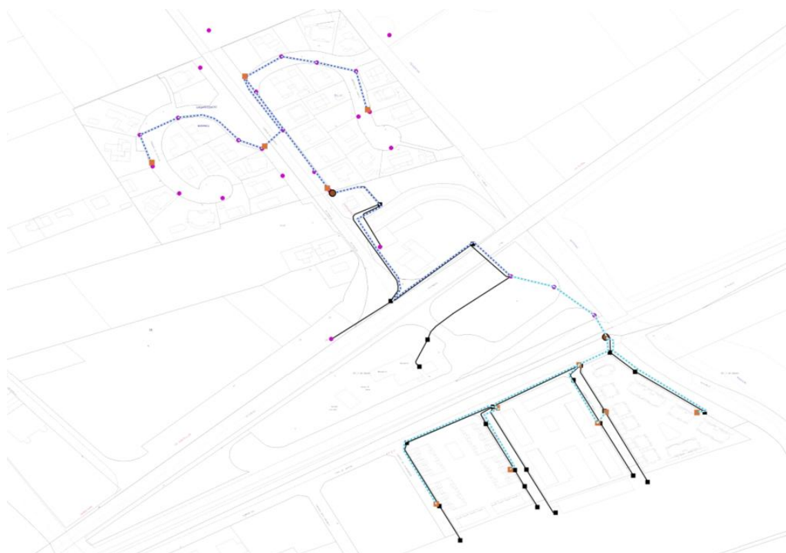
Zona 6.3 Mainou