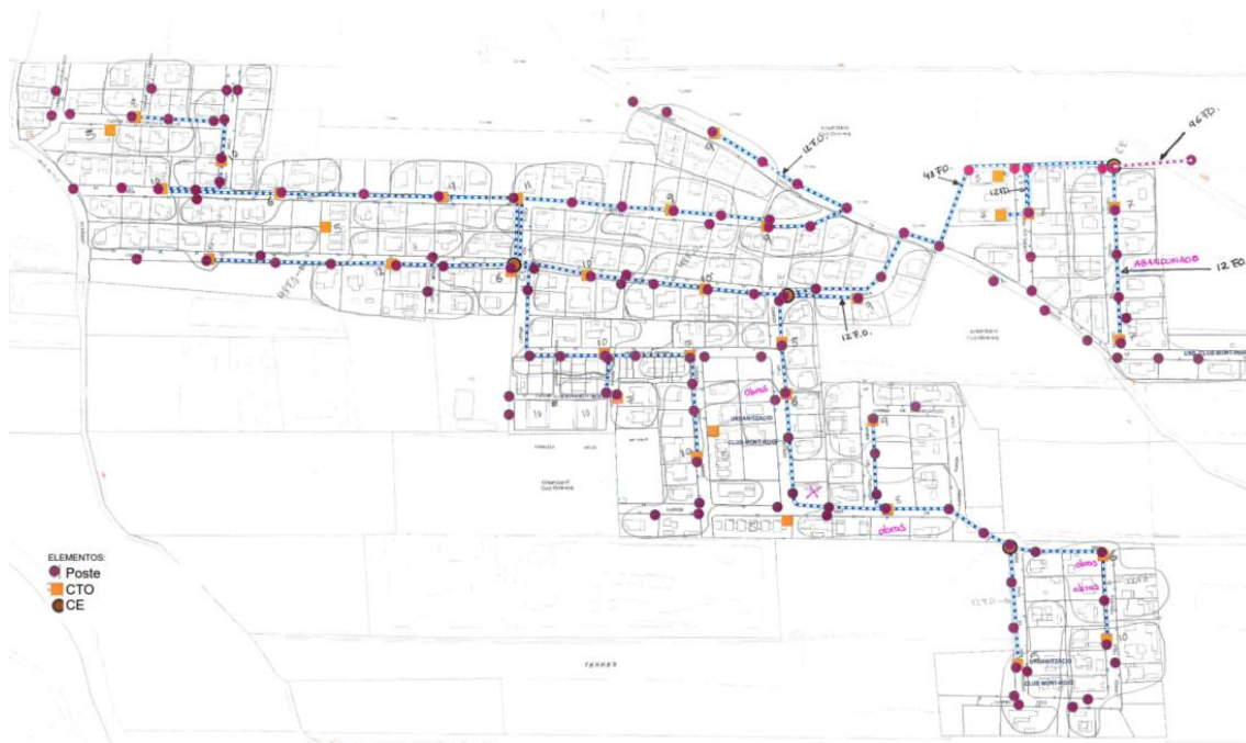
Zona 6.1 Club Mont-Roig

La nova ampliació s'ha dividit en 4 fases que es corresponen amb les 4 urbanitzacions a desplegar. Als següents plànols es pot observar el desplegament de la futura xarxa