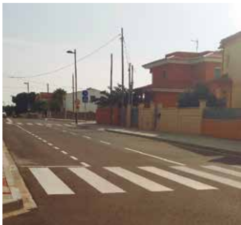
Nueva señalización horizontal en la Avenida Sevilla

Ambas actuaciones se enmarcan dentro del "Proyecto de intervención integral de renovación urbana del barrio de La Florida de Miami" aprobado en 2010 de acuerdo con la Ley de Barrios de la Generalitat de Catalunya.