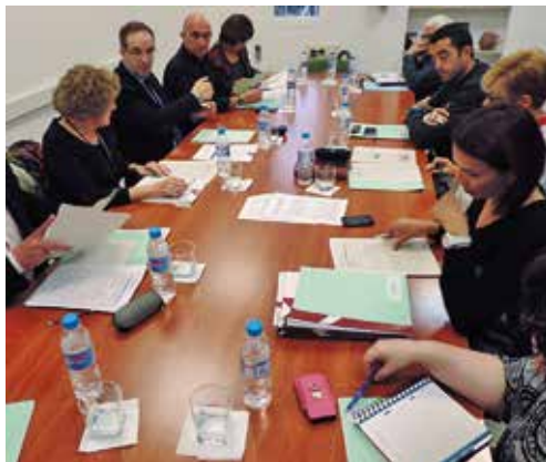
Mont-roig acogió el pasado 27 de noviembre la mesa mixta de "Ensenyament"