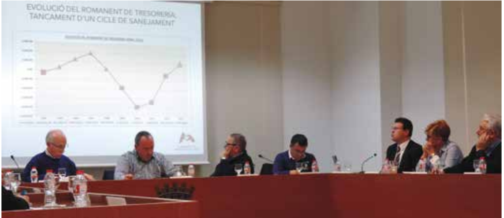
El consistorio apuesta por la prudencia y plantea un superávit inicial de 0,3 millones de euros

El pleno aprobó, el pasado 28 de noviembre, el presupuesto para el año 2015, con los votos a favor del equipo de gobierno, el concejal no adscrito Eduard Planas y los votos en contra de los grupos en la oposición PSC y CIU.